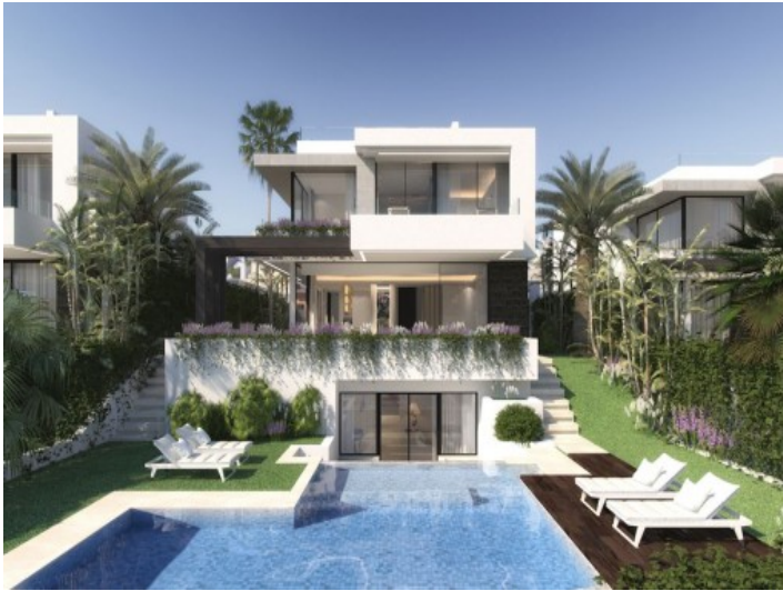
Außenansicht der Villa