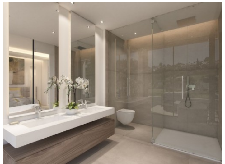
Badezimmer mit ebenerdiger Dusche

Alle Angaben nach bestem Wissen. Irrtum und Zwischenverkauf vorbehalten. Dieses Exposé ist eine Vorinformation, als Rechtsgrundlage gilt allein der notariell abgeschlossene Kaufvertrag.