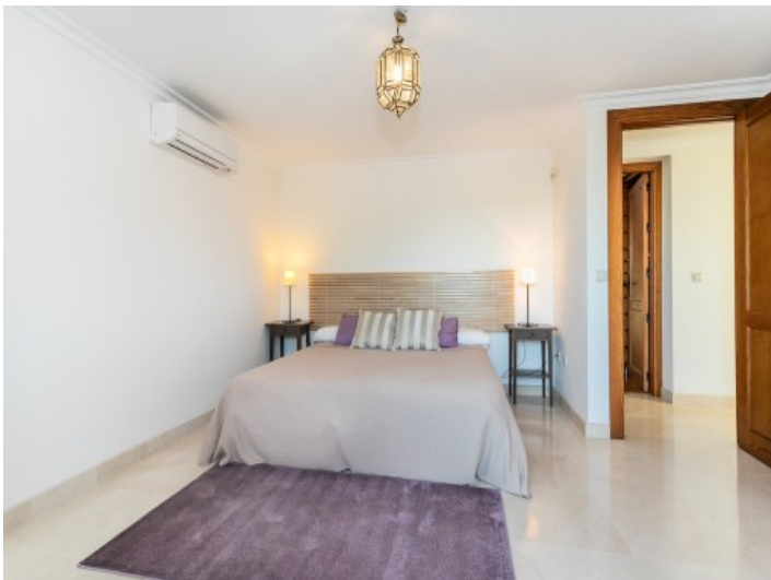
Weiteres komfortables Schlafzimmer