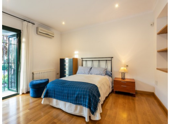
Schlafzimmer mit französischem Balkon