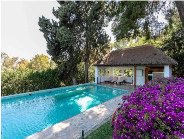
Alternative Ansicht des Poolbereiches