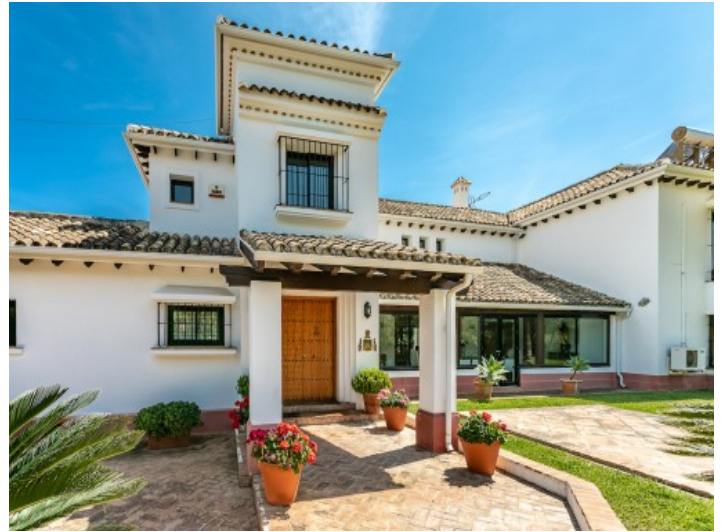
Vorderansicht und Eingangsbereich der Villa

Alle Angaben nach bestem Wissen. Irrtum und Zwischenverkauf vorbehalten. Dieses Exposé ist eine Vorinformation, als Rechtsgrundlage gilt allein der notariell abgeschlossene Kaufvertrag.