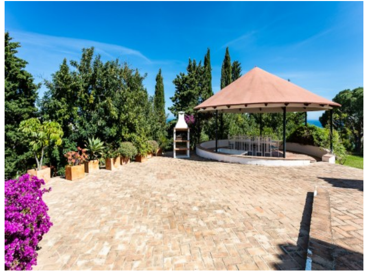
Großzügiger Außenbereich mit Pavillon und Meerblick