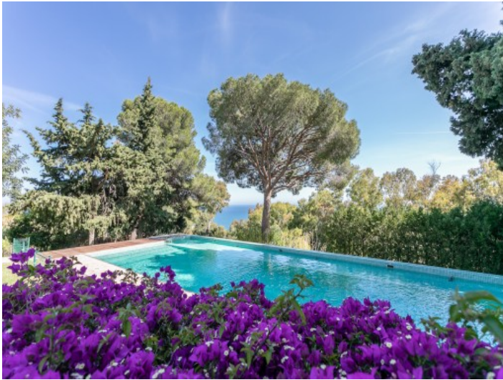
Poolbereich mit beeindruckendem Meerblick