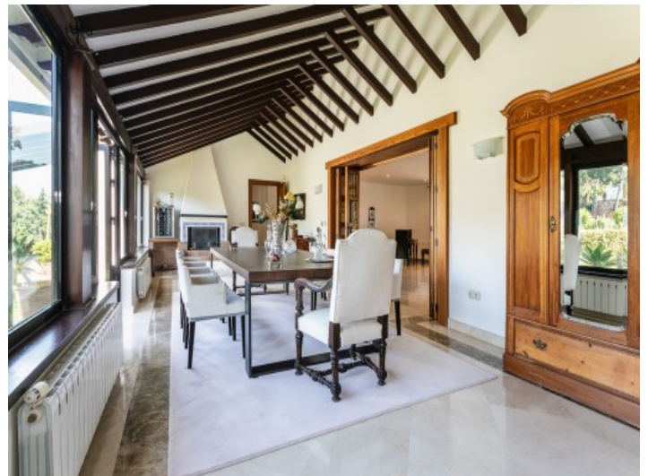
Der Essbereich bietet Platz für bis zu 10 Personen