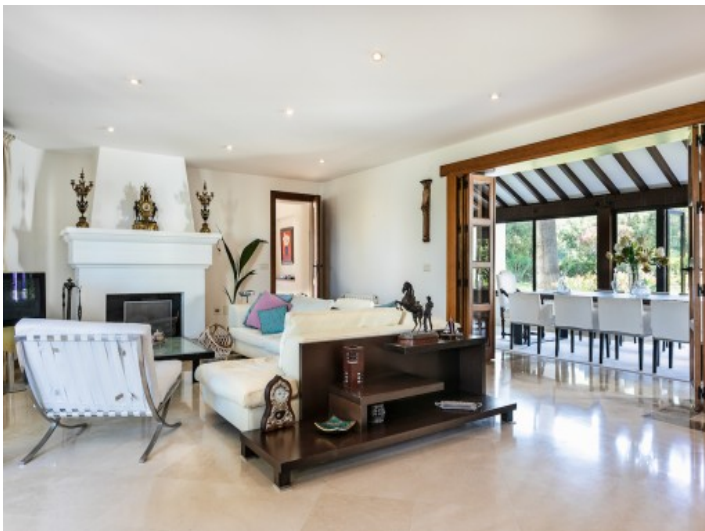
Lichtdurchfluteter Wohnbereich mit Kamin