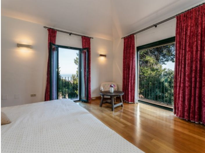
Das Schlafzimmer bietet einen atemberaubenden Meerblick