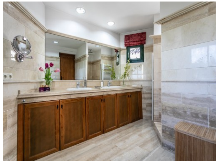
Badezimmer mit Tageslicht und Dusche