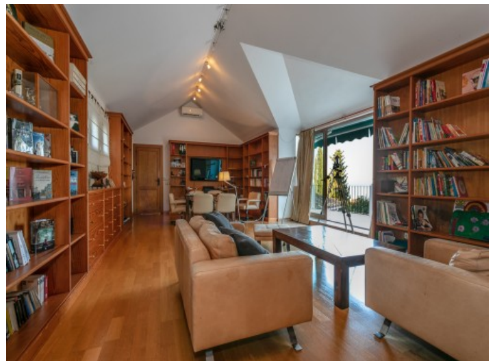
Bibliothek mit Terrassenzugang

Alle Angaben nach bestem Wissen. Irrtum und Zwischenverkauf vorbehalten. Dieses Exposé ist eine Vorinformation, als Rechtsgrundlage gilt allein der notariell abgeschlossene Kaufvertrag.