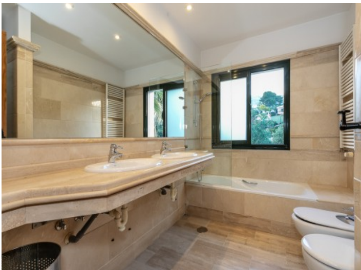
Weiteres Badezimmer mit Badewanne