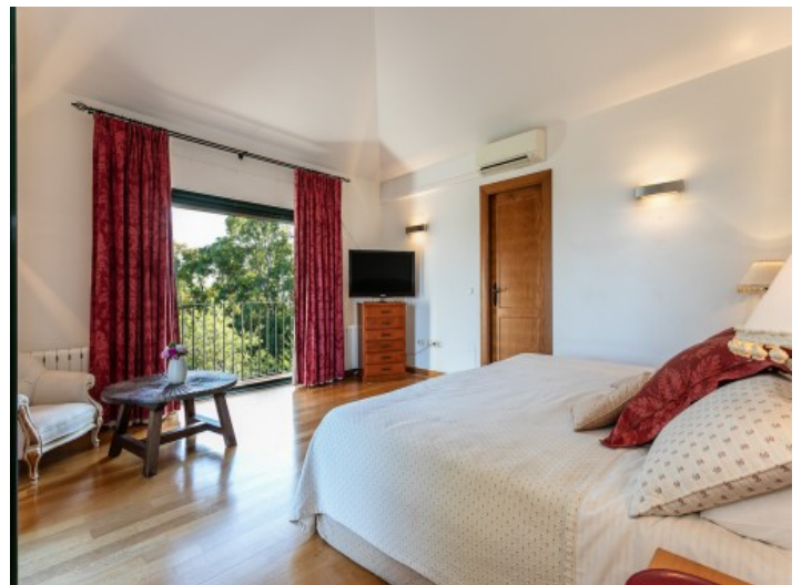
Gemütliches Schlafzimmer mit Doppelbett

Alle Angaben nach bestem Wissen. Irrtum und Zwischenverkauf vorbehalten. Dieses Exposé ist eine Vorinformation, als Rechtsgrundlage gilt allein der notariell abgeschlossene Kaufvertrag.