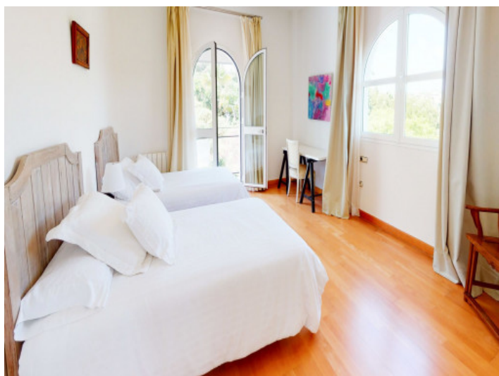
Eines von 7 Schlafzimmern