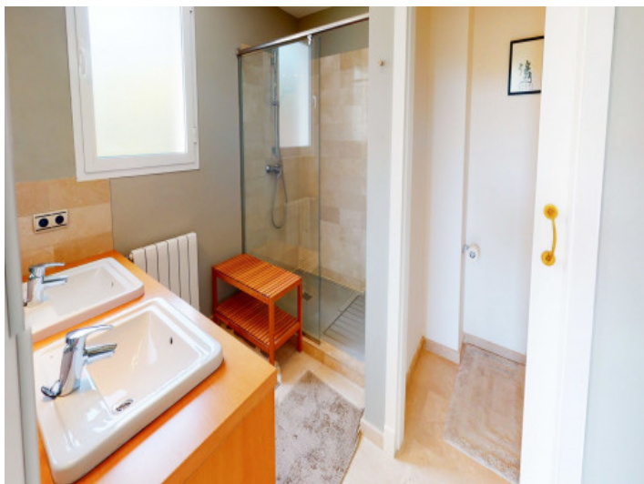
Eine von 4.5 Badezimmern