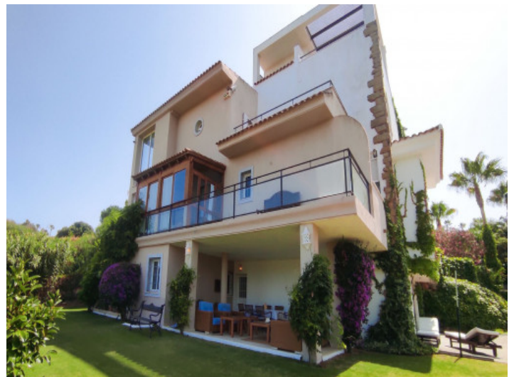
Ansicht auf die Villa

Alle Angaben nach bestem Wissen. Irrtum und Zwischenverkauf vorbehalten. Dieses Exposé ist eine Vorinformation, als Rechtsgrundlage gilt allein der notariell abgeschlossene Kaufvertrag.