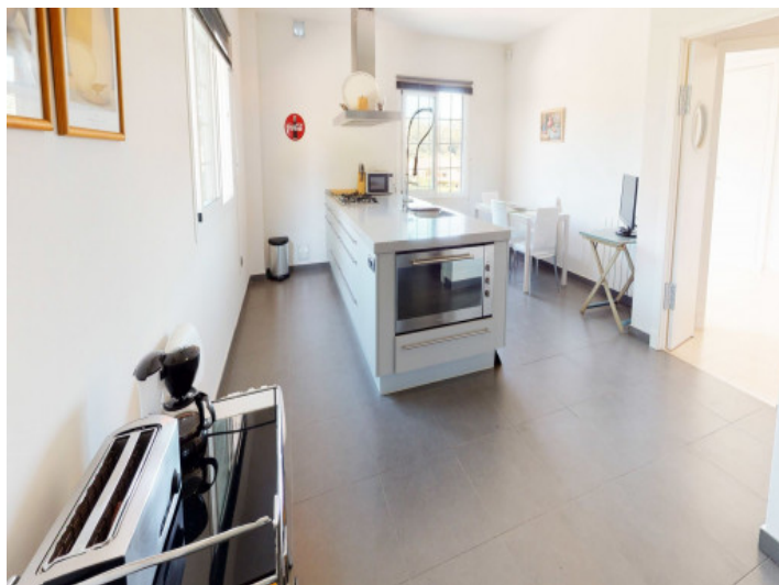
Küchen mit Kochinsel