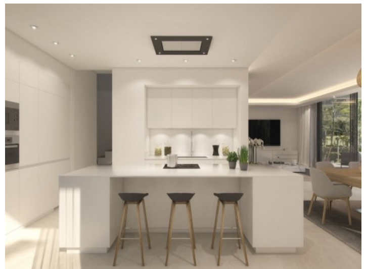
Moderne und voll ausgestattete Küche