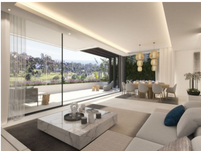
Puristischer Wohn- und Essbereich