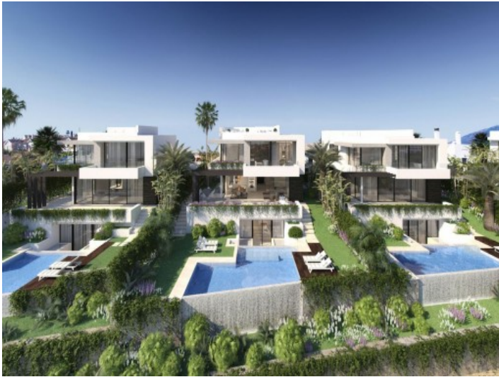
Außenansicht des modernen Komplexes