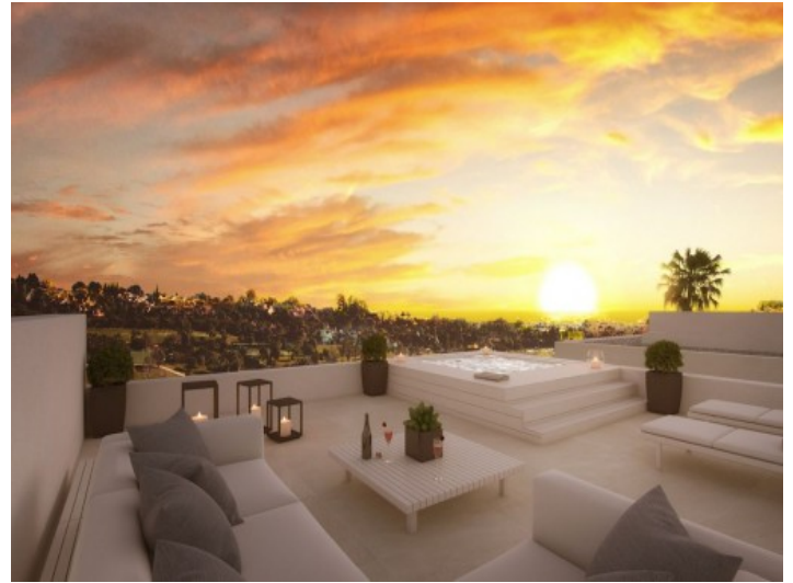
Dachterasse mit Whirlpool und beeindruckender Aussicht