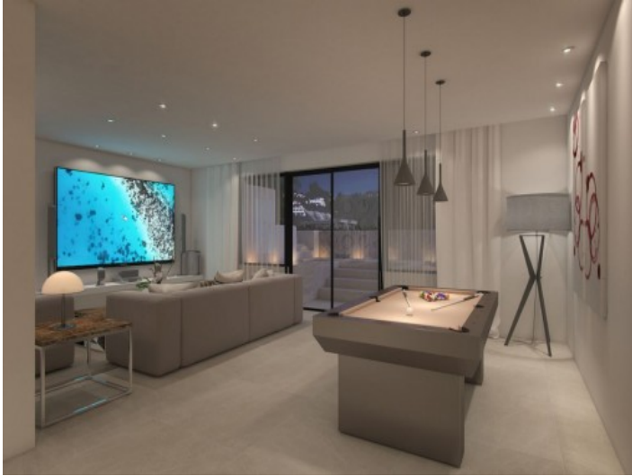
Billardraum und Heimkino