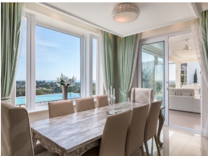
Der Essbereich bietet Platz für bis zu 8 Personen