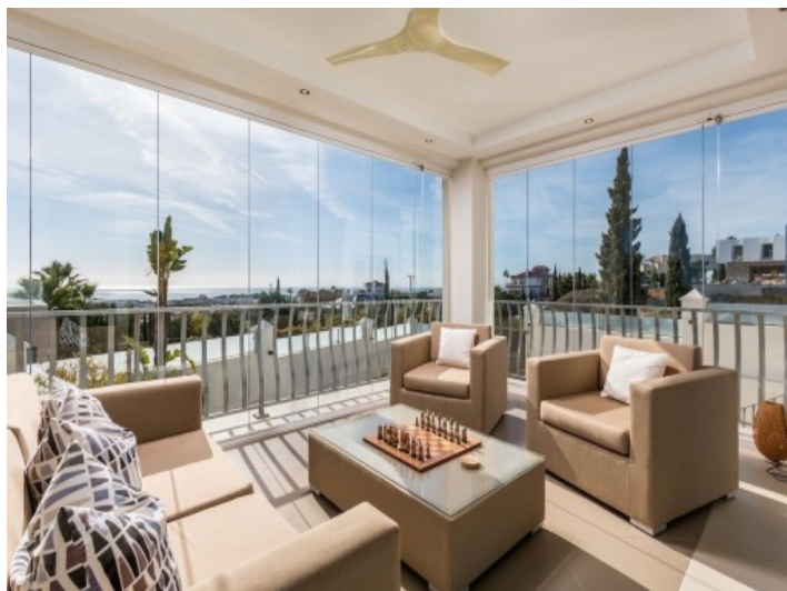
Gästeapartment mit herrlichem Meerblick