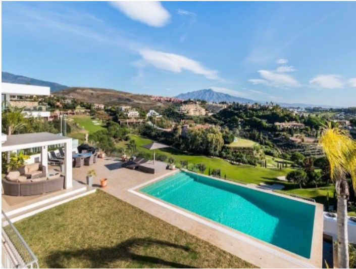
Fantastischer Blick auf die Berge