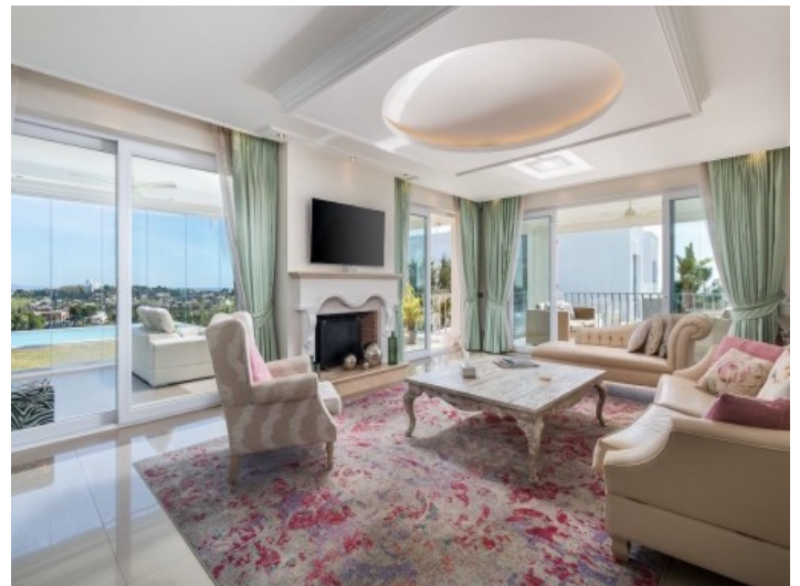
Gemütlicher Wohnbereich mit Kamin