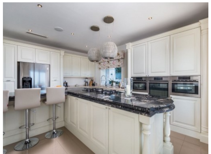
Moderne und voll ausgestattete Küche

Alle Angaben nach bestem Wissen. Irrtum und Zwischenverkauf vorbehalten. Dieses Exposé ist eine Vorinformation, als Rechtsgrundlage gilt allein der notariell abgeschlossene Kaufvertrag.