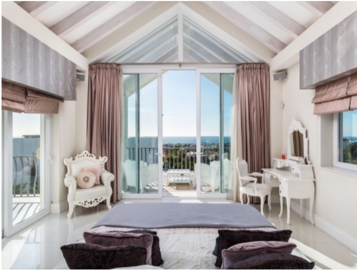
Eines von 9 Schlafzimmern