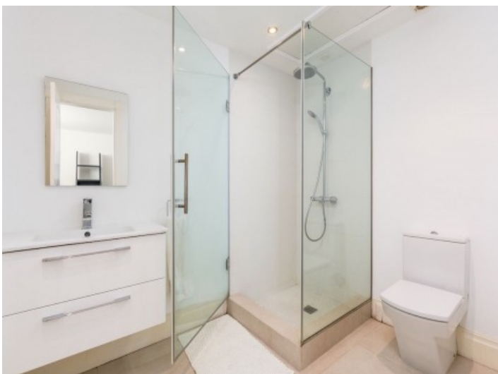
Eines von 6 Badezimmern