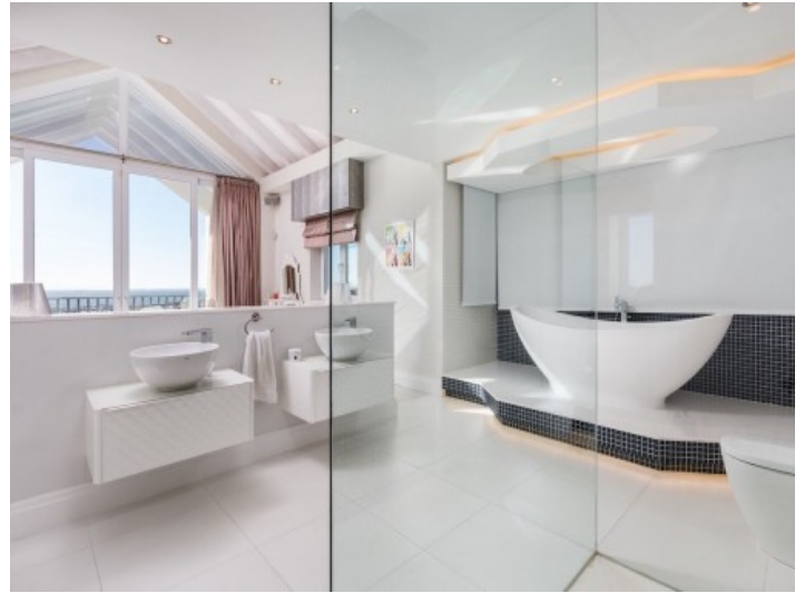
Eines von 6 Badezimmern