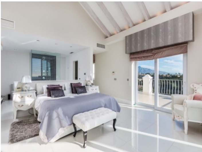
Eines von 9 Schlafzimmern