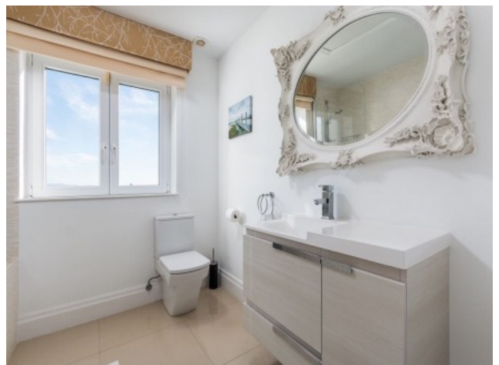
Eines von 6 Badezimmern

Alle Angaben nach bestem Wissen. Irrtum und Zwischenverkauf vorbehalten. Dieses Exposé ist eine Vorinformation, als Rechtsgrundlage gilt allein der notariell abgeschlossene Kaufvertrag.