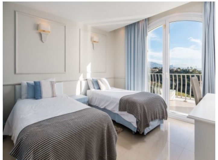
Eines von 9 Schlafzimmern