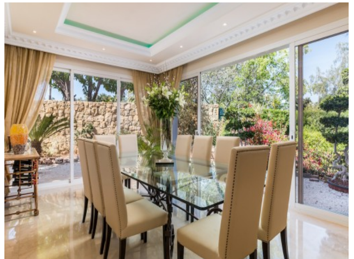
Essbereich mit Panoramafenstern