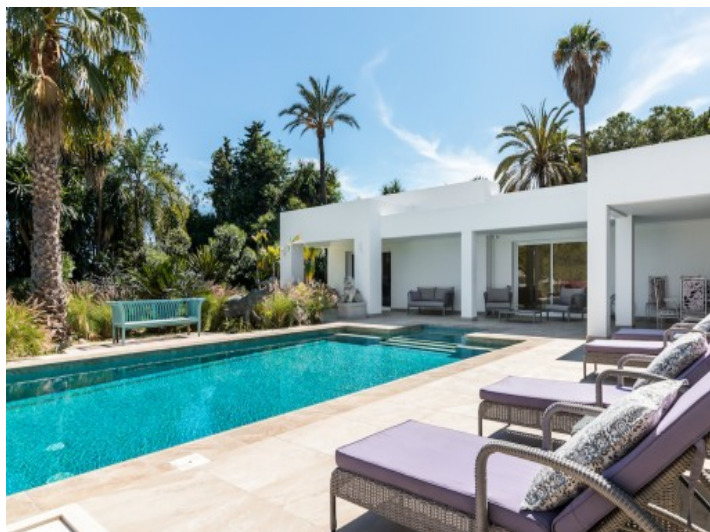
Poolbereich mit gemütlichen Sonnenliegen