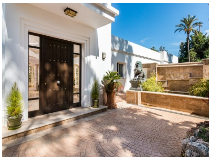
Eingang der Villa

Alle Angaben nach bestem Wissen. Irrtum und Zwischenverkauf vorbehalten. Dieses Exposé ist eine Vorinformation, als Rechtsgrundlage gilt allein der notariell abgeschlossene Kaufvertrag.