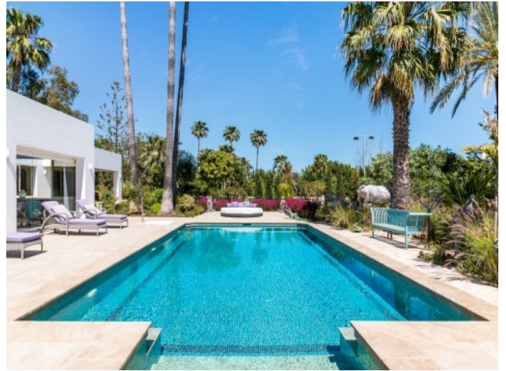
Herrliche Villa mit großem Garten in Estepona