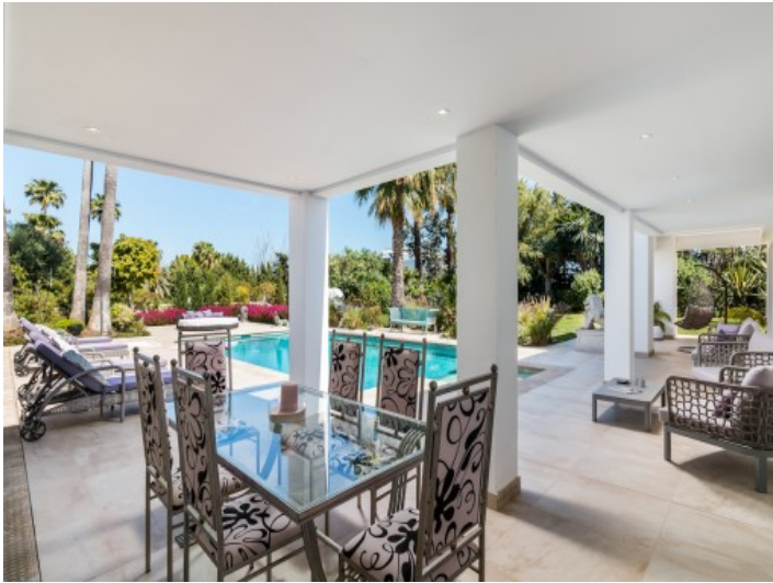
Charmante Terrasse mit Essbereich