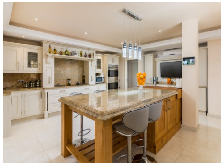
Große, voll ausgestattete Küche

Alle Angaben nach bestem Wissen. Irrtum und Zwischenverkauf vorbehalten. Dieses Exposé ist eine Vorinformation, als Rechtsgrundlage gilt allein der notariell abgeschlossene Kaufvertrag.