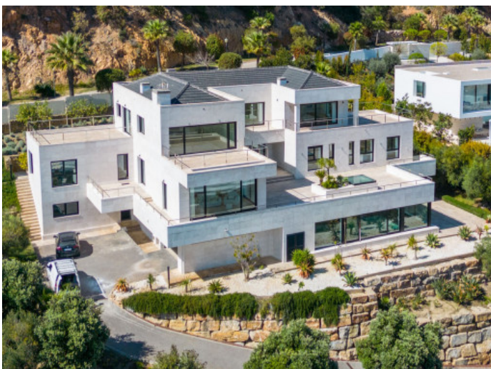
Blick aus der Vogelperspektive

Alle Angaben nach bestem Wissen. Irrtum und Zwischenverkauf vorbehalten. Dieses Exposé ist eine Vorinformation, als Rechtsgrundlage gilt allein der notariell abgeschlossene Kaufvertrag.