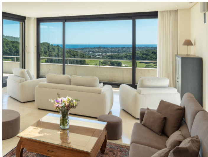
Wohnbereich mit Panoramafenster