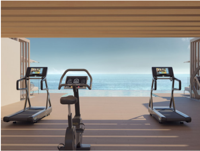
Fitnessraum mit herrlicher Aussicht