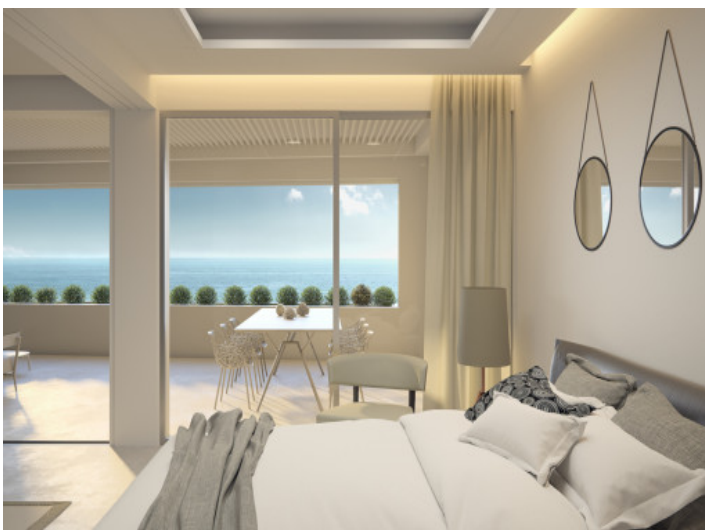
Schlafzimmer mit beeindruckender Aussicht