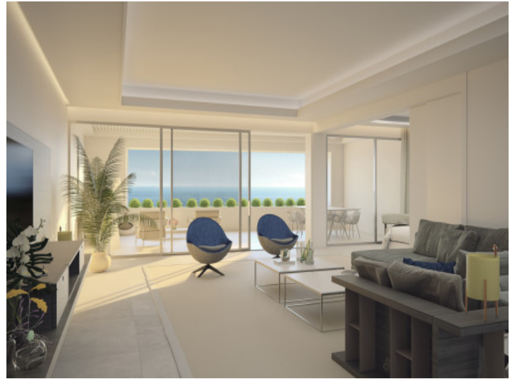
Modern designer Wohnbereich