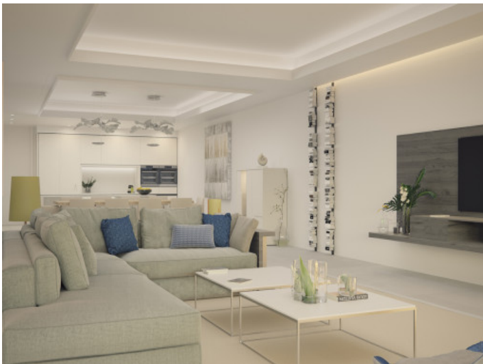
Großzügiger Wohn- und Essbereich