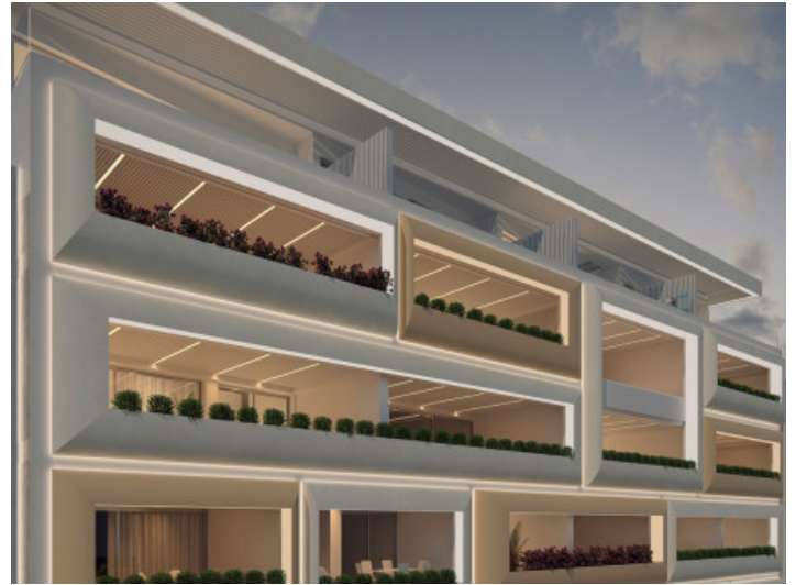
Außenansicht der Luxusapartments

Alle Angaben nach bestem Wissen. Irrtum und Zwischenverkauf vorbehalten. Dieses Exposé ist eine Vorinformation, als Rechtsgrundlage gilt allein der notariell abgeschlossene Kaufvertrag.