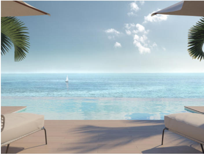
Pool mit traumhafter Aussicht