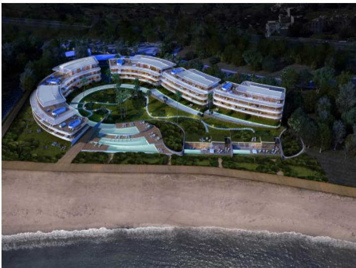
Der Komplex aus der Vogelperspektive

Alle Angaben nach bestem Wissen. Irrtum und Zwischenverkauf vorbehalten. Dieses Exposé ist eine Vorinformation, als Rechtsgrundlage gilt allein der notariell abgeschlossene Kaufvertrag.