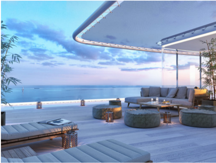
Überdachte Terrasse in erster Meereslinie