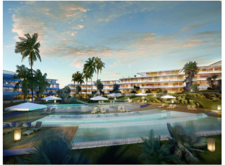
Riesige Pool und Gartenlandschaft