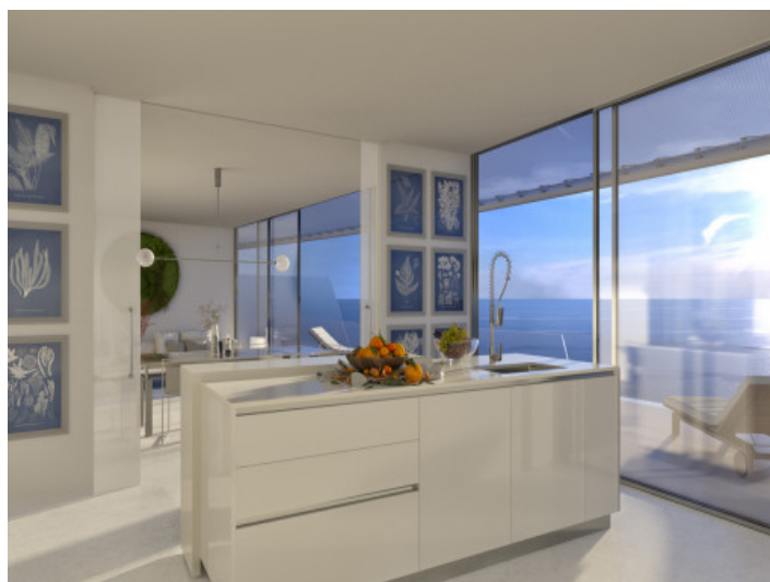
Offen gestaltete, voll ausgestattete Küche