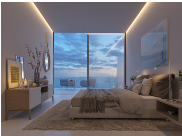
Eines von 3 Schlafzimmern