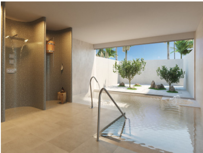
Schöner Indoor pool