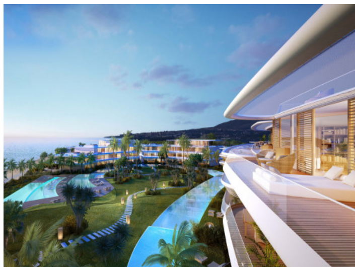
Terrasse mit herausragendem Meerblick

Alle Angaben nach bestem Wissen. Irrtum und Zwischenverkauf vorbehalten. Dieses Exposé ist eine Vorinformation, als Rechtsgrundlage gilt allein der notariell abgeschlossene Kaufvertrag.